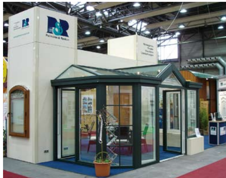
P&R-Messestand auf der NordHaus ... und auf der Gewerbeschau in Wittmund

22. April war unsere Werksvertretung Erwin Renken vor Ort, um interessierte Besucher zu beraten. Blickfang auf beiden Ständen war – neben einer Haustür im System AluFusion – ein kleinerer blauer Wintergarten, der mit unterschiedlichen Schmuckverglasungen zeigt, welche individuellen Akzente auch hier gesetzt werden können.