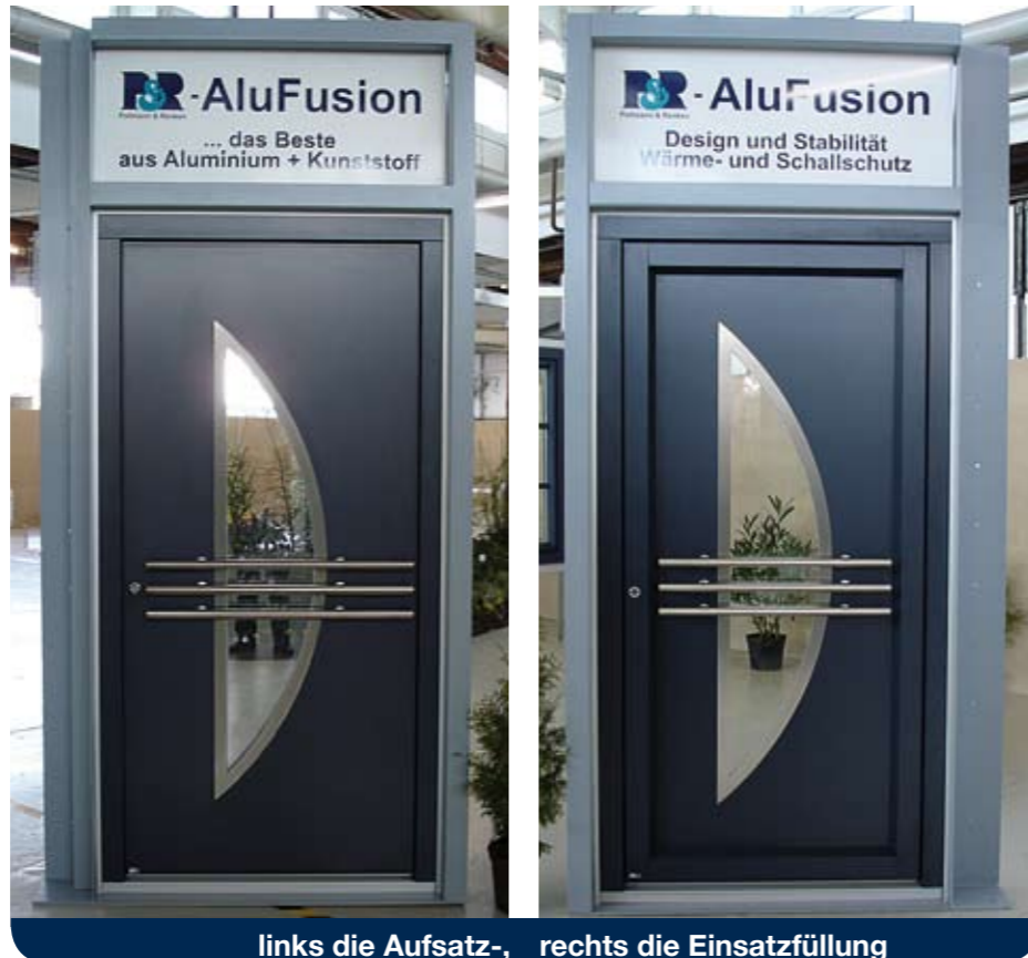
links die Aufsatz-, rechts die Einsatzfüllung

Der Messewintergarten ganz im neuen System AluFusion kam dann rund vier Wochen später bereits wieder auf der NordHaus in Oldenburg zum Einsatz und zog viele Blicke auf sich. Er überzeugt durch seine elegante Erscheinung, die auch durch eine dezente Schmuckverglasung im vorderen Giebel unterstützt wird. Insgesamt war diese Baufachmesse in Oldenburg gut besucht und hielt viele Informationen für alle Besucher bereit.