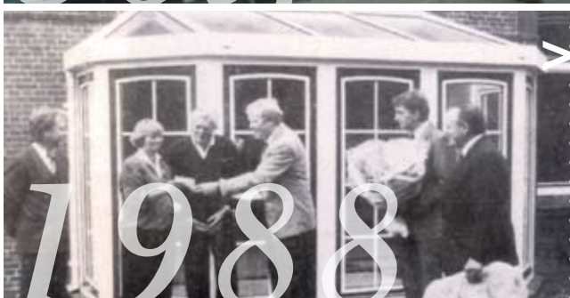
>> Ein Glückwunsch geht 1988 an die stolzen Besitzer des 500. P&R Wintergartens