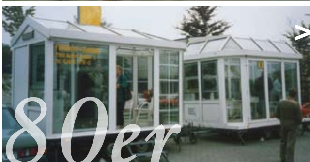
>> Bereits Ende der 80er Jahre präsentierte P&R den „rollenden Wintergarten- Anhänger“