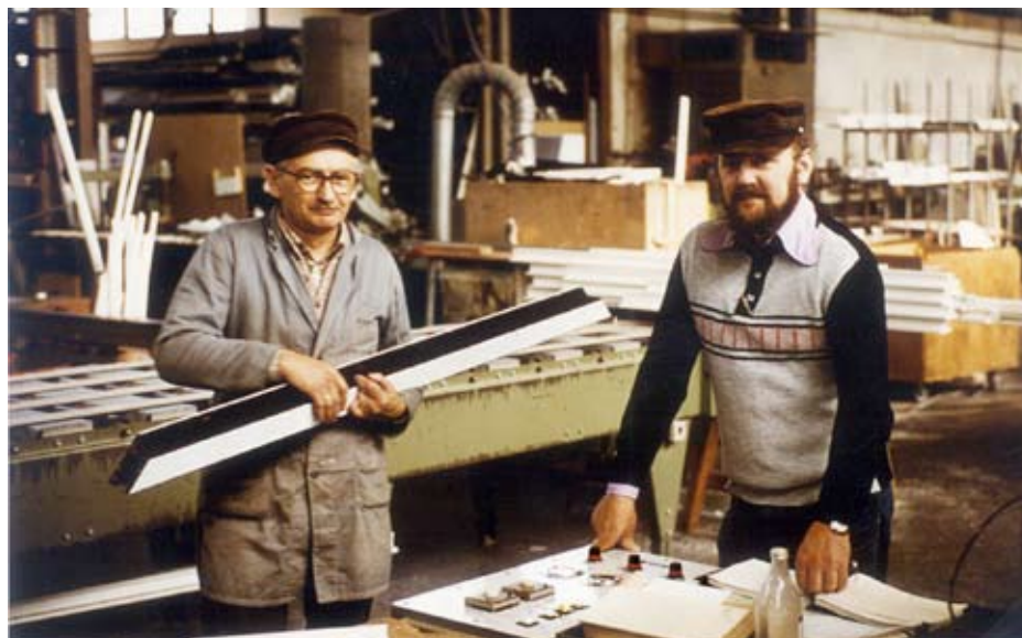
Schon in den Siebziger Jahren waren handwerkliches Geschick und moderne Fertigungstechniken der Schlüssel zum Erfolg.

Es sind in der heutigen Zeit jedoch nicht allein die reinen Produktmerkmale, mit denen man im Wettbewerb bestehen kann. Immer mehr Bedeutung gewannen im Lauf der Jahre eine intensive Beratung sowie ein professioneller Kundendienst und Service. Basis hierfür ist eine motivierte, engagierte und gut ausgebildete Belegschaft – eine gesunde Mischung aus langjährigen Mitarbeitern und jungen Nachwuchskräften. Weit über 100 Auszubildende haben bisher ihren Abschluss bei P&R gemeistert, viele davon wurden übernommen und sind inzwischen erfolgreich im Innen- und Außendienst. Vertrauen, Kompetenz und Zuverlässigkeit sind Auszeichnung und Ansporn zugleich. Pollmann & Renken ist gut gerüstet für die Zukunft und nimmt diese Herausforderung gerne an.