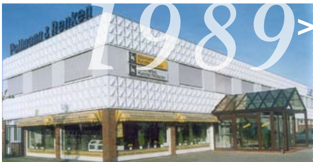
>> 1989 – der erste Wintergarten erweitert die Ausstellung in Aarich