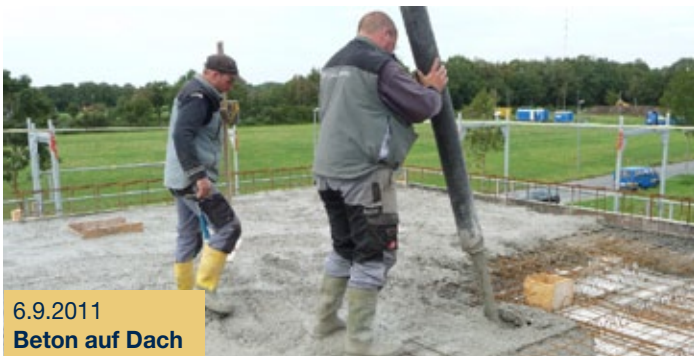
6.9.2011 Beton auf Dach