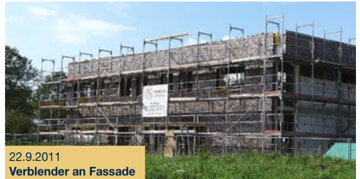
22.9.2011 Verblender an Fassade