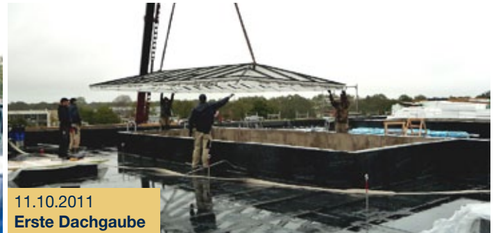
11.10.2011 Erste Dachgaube

Im Gewerbegebiet Schirum II beginnt nach Fertigstellung des Rohbaus der Innenausbau